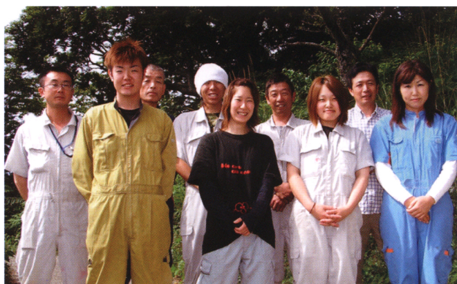
弟である浩人専務(右から4人目)を中心に、常陸牧場を支えるパワー溢れるスタッフの皆さんと

常陸牧場のスタッフは9人。養豚がやりたくて応募してきた3~4年目の若手を中心に、明るくパワフルな雰囲気に満ちています。「新人でもすべて任せて口を