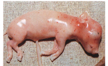
図2 流産胎児の皮膚の点状出血（原図：参考文献1）

や虚弱子豚の娩出が見られます。わが国におけるレプトスピラ症の発生報告はすべてこのような異常産です。これまで、愛知、沖縄、群馬、千葉、岡山等でレプトスピラによる流死産が報告されていますが、中でも沖縄県では常在化しているのではないかと推測されています。流死産は初産あるいは2産目に多く、また妊娠後半の81日以降が圧倒的に多いことが明らかにされています。