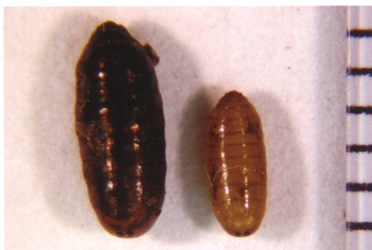
写真1 イエハエ蛹。左：正常、右：IGR処理

これまでに、ハエ類・カ類(以下、ハエ)が豚舎においてしばしば問題になることをまとめました。ハエ対策は卵・幼虫・蛹を防除する発生源対策と成虫対策が基本となります。発生源対策は除糞などの環境的対策が有効ですが、労力の問題から殺虫剤を使用することもあります。発生源対策で特異的に用いられるものとして昆虫成長制御剤(Insect Growth Regulator: IGR)があります。IGRは「幼若ホルモン様物質」と「表皮形成阻害剤」に大別されます。前者は蛹化と羽化、後者は幼虫の脱皮、蛹化および羽化を阻害します(写真1)。すなわち、IGRは成虫以外の発育段階(有効成分により作用時期は異なる)に有効です。また、IGRは人畜に対する負荷が少ないという利点もあります。一方、成虫対策は壁や天井などハエの休息する場所にあらかじめ散布しておきハエに薬剤を接触させる方法(残留散布)や、空間に散布する方法(空間散布)があります。