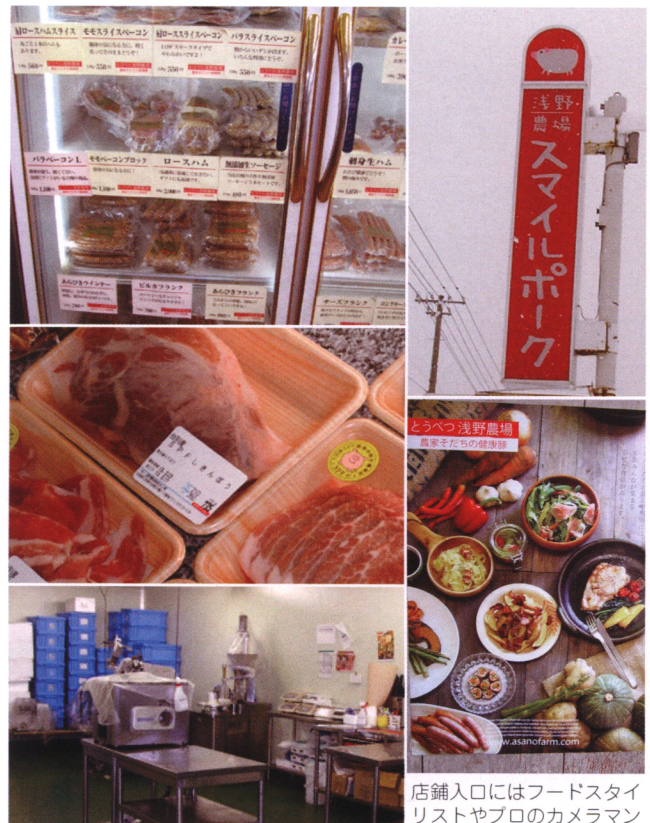
多彩な加工品（上）と精肉類（中） 店舗に隣接する加工場（下）

自慢は多彩な品揃え。精肉ではもも肉の一番やわらかい部分を「しきんぼう」としてブロック販売したり、豚ジギスカン用、豚蒲焼きの具などの味付肉を商品にしたり。加工品ではユニークな「愛犬・飼い主共用豚軟骨」（調味料なしで長時間煮こみ人が食べてもペットが食べてもおいしいと