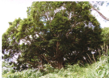
農場のシンボル、見事なブナの大木。銘柄豚「榊豚」(ぶなぶた)の由来にも(右)

出さない。最初は当然成績が落ちるけどそこは我慢。するとみんな成長する。それがうれしい。スタッフが成績を上げてくれることがありがたいですね」。月に一度の勉強会などの取り組みで成績も向上してきました。